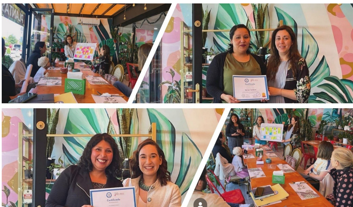
Fotografías: Cierre Programa de Mentorías para mamás de niños con cáncer.