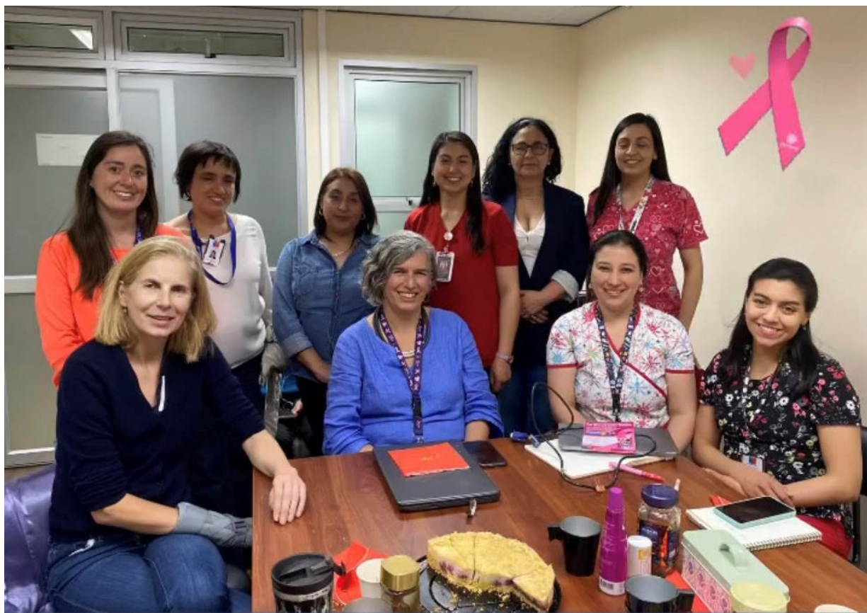
Fotografía: 1° Reunión Red de Apoyo cáncer de mama, Fundación Por mi y por todas, Villarrica, Fundación Lazos Unidos, Temuco, Equipo de Matronas Oncología Hospital Hernán Henríquez Aravena y Corporación Más Mujeres Líderes.

15. RECONOCIMIENTO A 100 MUJERES LÍDERES DE LA ARAUCANÍA: El evento 100 Mujeres Líderes de La Araucanía, tiene su origen en el año 2019, en el marco del, en ese entonces Proyecto Más Mujeres Líderes, realizado por CorpAraucanía con apoyo del Gobierno Regional a través de Corfo. Su objetivo es promover la participación de más mujeres en áreas relevantes para el desarrollo regional, y está enfocado en reconocer anualmente a aquellas mujeres destacadas en diversos ámbitos de la Región de La Araucanía. Este 2023 celebramos ya la 5° versión del evento, habiendo a la fecha premiado a 500 mujeres. Organismos colaboradores: Diario Austral y CorpAraucanía. / Auspicia: Universidad Autónoma de Chile.