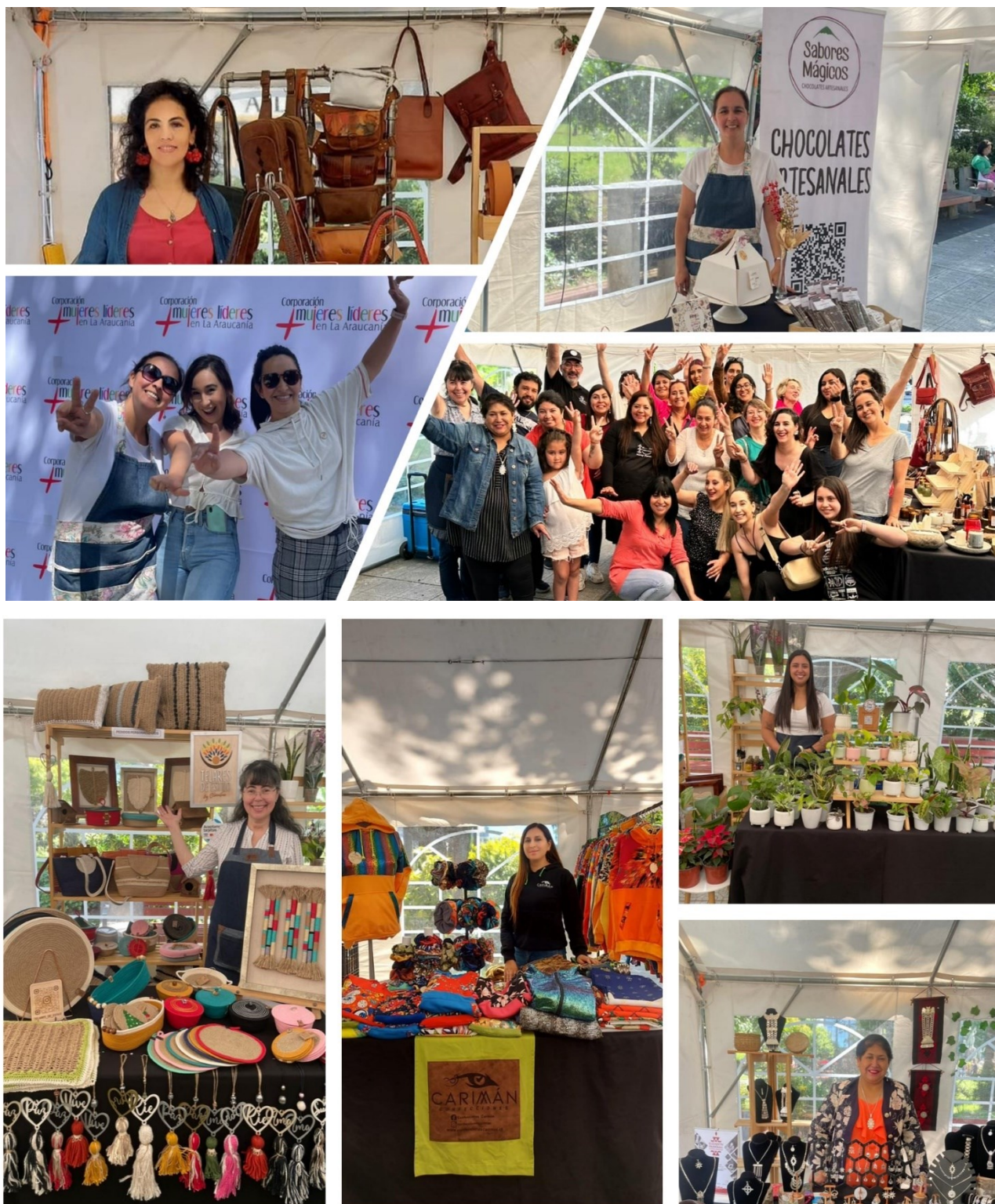
Fotografías: Extracto 1° Expo Navidad, Corporación Más Mujeres Líderes en La Araucanía, 2023.