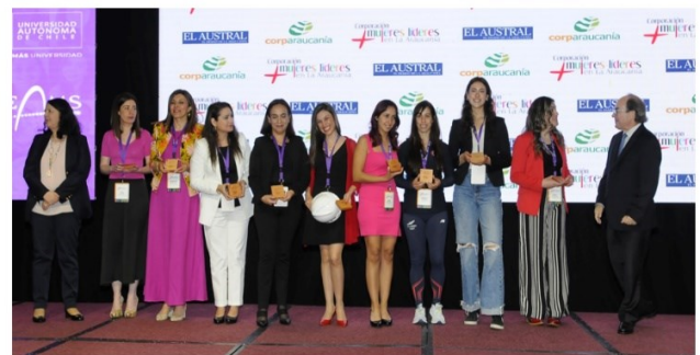
Fotografías: Ceremonia de reconocimiento a 100 Mujeres Líderes de La Araucanía, versión 2023.