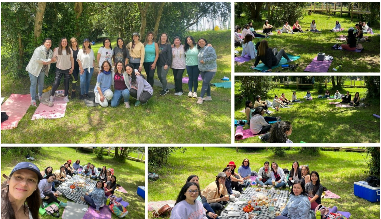
Fotografías: Taller de Mindfulness y jornada de camaradería, Conmemorando el Día internacional de la violencia contra la Mujer.