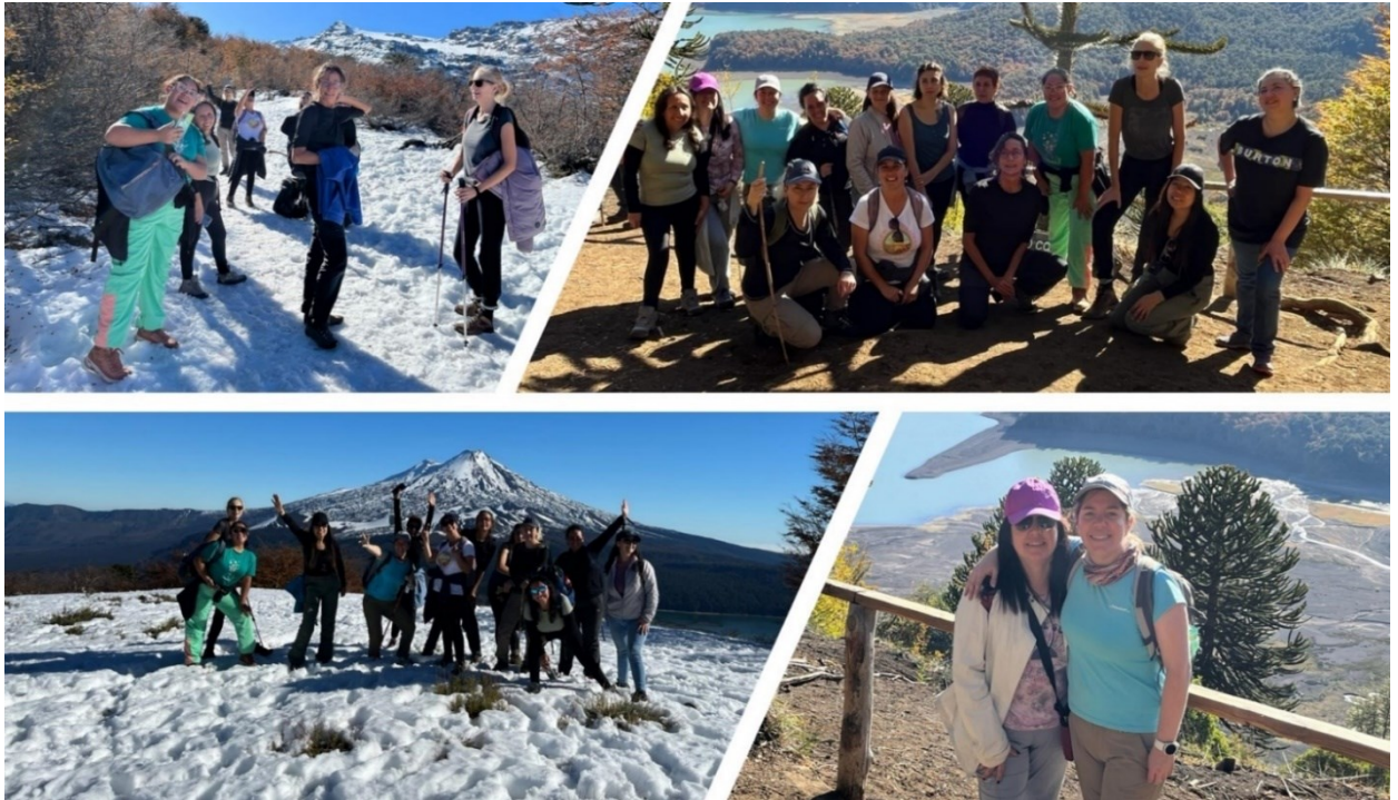
Fotografías: Jornada de Trekking Parque Nacional Conguillío