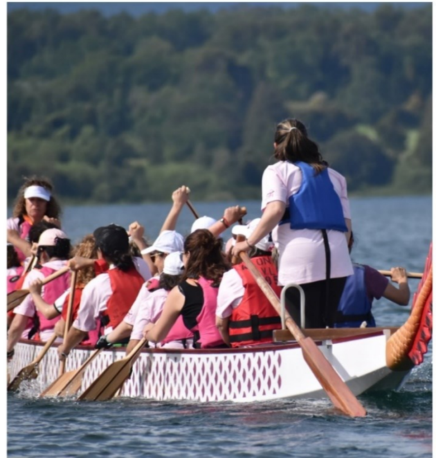
Fotografías: Festival Por mí y por todas, comuna de Villarrica.

17. PRIMERA EXPO NAVIDAD: 1° Feria Navideña, realizada desde el 19 al 21 de diciembre en la Plaza Aníbal Pinto de la ciudad de Temuco. La actividad convocó a una veintena de emprendedoras de la región, contando con variados productos de fabricación propia y de muy alto nivel. Actividad organizada por la comisión de emprendimiento de nuestra corporación.