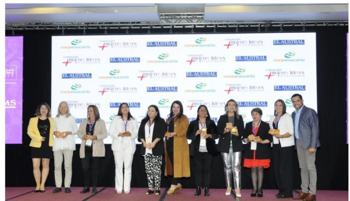
Fotografías: Ceremonia de reconocimiento a 100 Mujeres Líderes de La Araucanía, versión 2023.