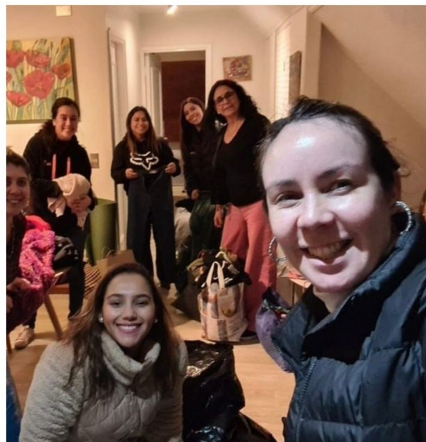
Fotografías: Campaña de recolección de ropa “Abrega a una Mujer”.