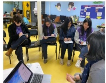
Fotografías: Intervenciones del Programa Piloto aplicado a alumnas de 4° medio del colegio Cumbres, de Labranza.