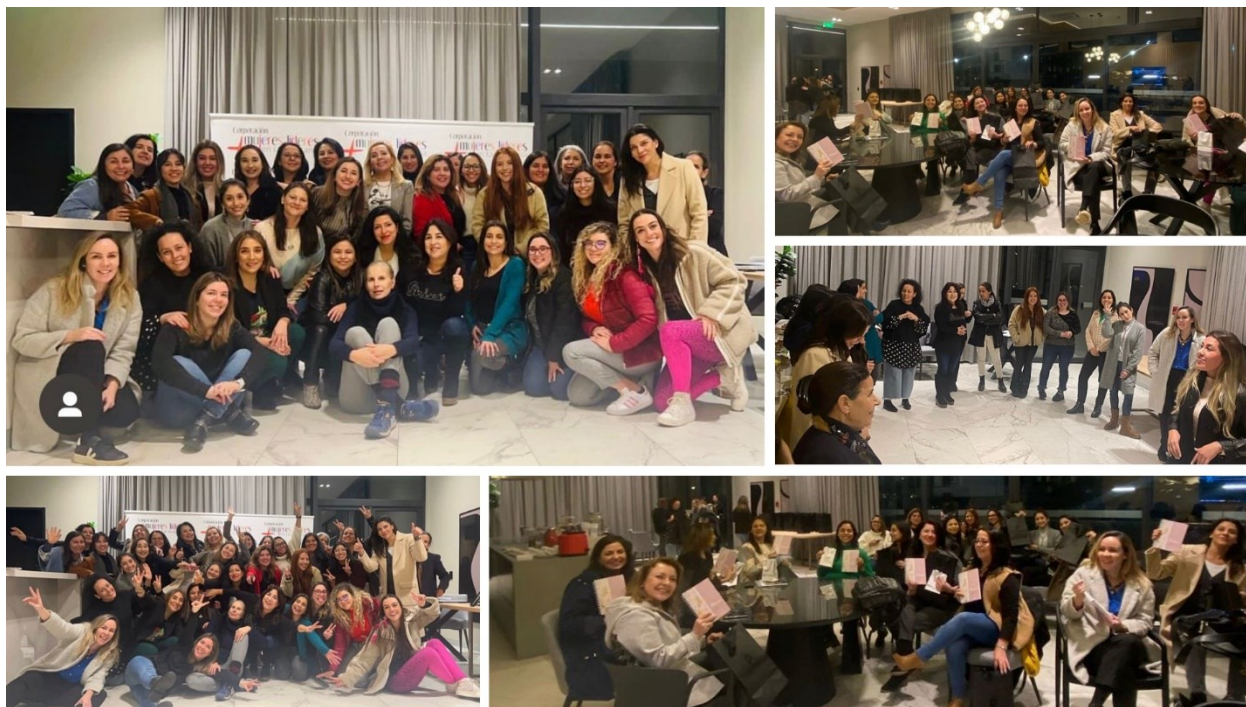
Fotografías: Reunión cierre de semestre, PLAENGE.